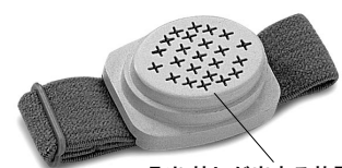
取り外しが出来る放電ユニット