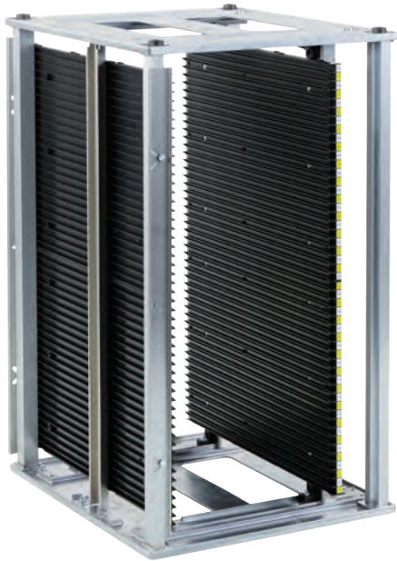
600:ネジ止め固定タイプ