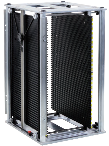
800:ギアベルト付幅可変タイプ (手動・モーター制御対応)