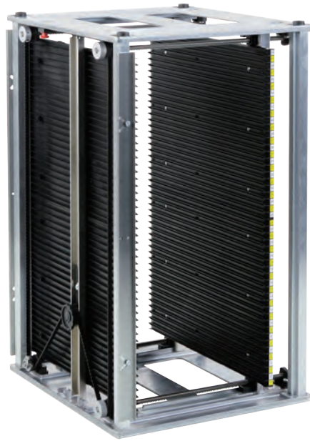
700:ギアベルト付幅可変タイプ