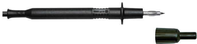
キャップ無し→ 1000V CAT II

キャップを付けると、1000V CAT III/1000V CAT IVとして使用出来ます。(型番471x-xD)