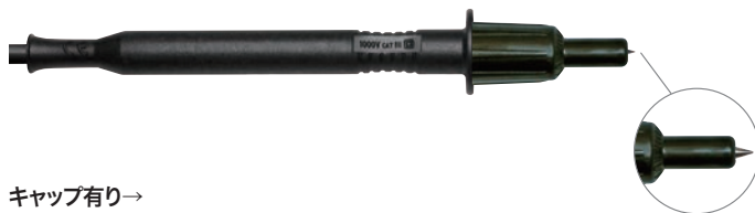
キャップ有り→ 1000V CAT III/600V CAT IV